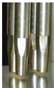
Düsenanzahl individuell konfigurierbar